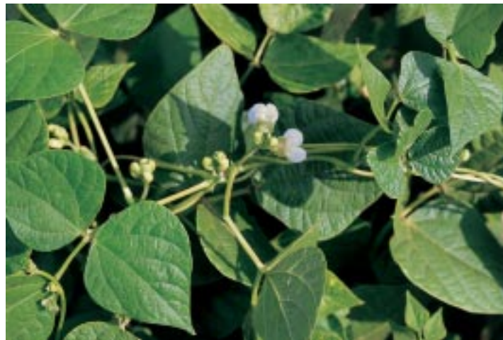
Já é possível cultivar um feijão resistente ao vírus do mosaico dourado do feijoeiro

Com o avanço da engenharia genética, o melhoramento de sementes ficou muito mais rápido, preciso e eficiente. O homem manipula o DNA, troca genes e consegue exatamente a