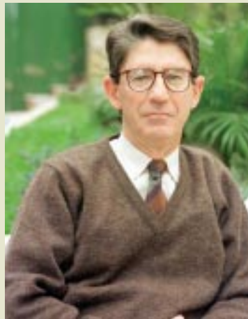
Melo: é a “nova Revolução Verde”

Um dos argumentos econômicos contra a soja transgênica é o da possibilidade da criação de um mercado de soja tradicional com cotação superior, por conta da resistência da União Européia às espécies geneticamente modificadas. Mas até agora esse mercado não existe. O Brasil não consegue um