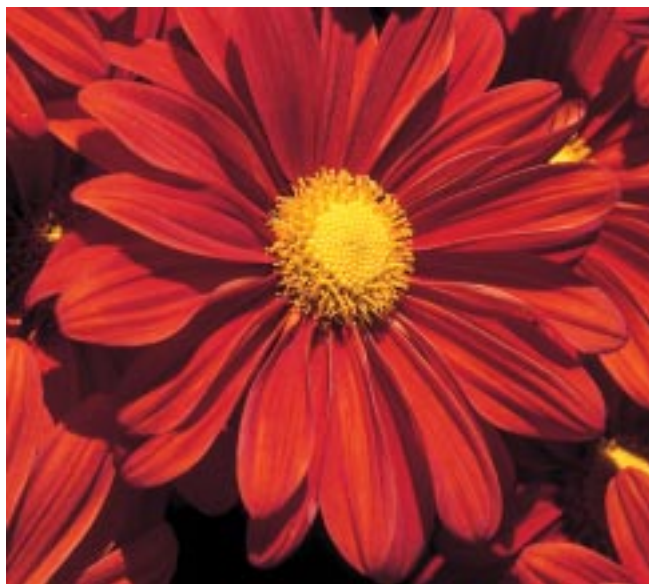
Na China, uma ferramenta ancestral: o crisântemo em pó era usado como defensivo agrícola

Estudos da Faculdade de Economia e Administração da USP revelam que as inovações do tipo biológico ou químico, bem como as mecânicas, contribuem para a maior produtividade da agricultura. Na ponta final do processo, dizem os economistas, estará um consumidor mais satisfeito com a redução do preço dos alimentos. “Nesse sentido, a biotecnologia é uma inovação de grandes repercussões”, acentua Fernando Homem de Melo, pesquisador da Fipe-USP.